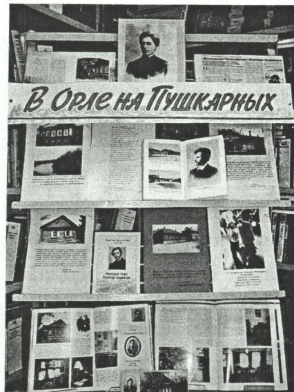
Выставка о жизни и творчестве Л. Андреева

Электронная библиотека «Im Werden», несмотря на немецкое название и размещение на немецком сервере, является одной из самых интересных и изысканных отечественных электронных библиотек. Её создателя отличает утончённый вкус и глубокое знание литературы. Особенность «ImWerden» — наличие редких дореволюционных или послереволюционных публикаций, а также внимание к литературному наследию русской эмиграции. Текстовые материалы представлены в виде PDF-файлов, поэтому их вид зачастую соответствует оттискам оригиналов с дорево-