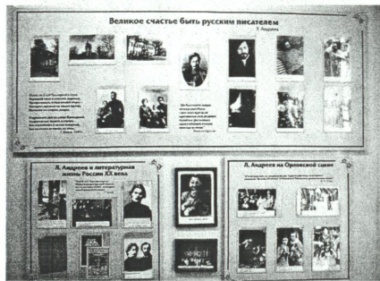
Стенд в библиотеке, посвящённый Л. Андрееву

В Сети также широко представлены воспоминания о Леониде Андрееве. Писатель был феерически популярен в начале прошлого века, его называли «Сфинксом российской интеллигенции». В воспоминаниях современников Андреев предстаёт великолепным рассказчиком, живым общительным чело-