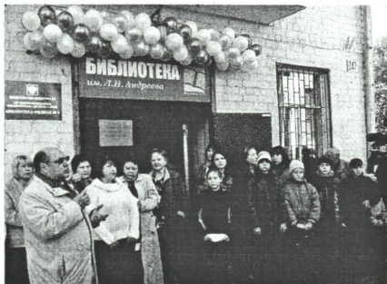
Праздник, посвящённый присвоению филиалу №5 имени Андреева

Среди других электронных библиотек стоит назвать Интернет-библиотеку Алексея Комарова, Публичную элек-