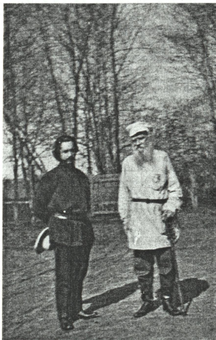
Л. Андреев и Л. Толстой в Ясной Поляне

Интернет — действительно мощное орудие поиска. Книга же — для работы ума и для душевного удовольствия. Очень важно не противопоставлять, а сочетать книжную культуру и элек-