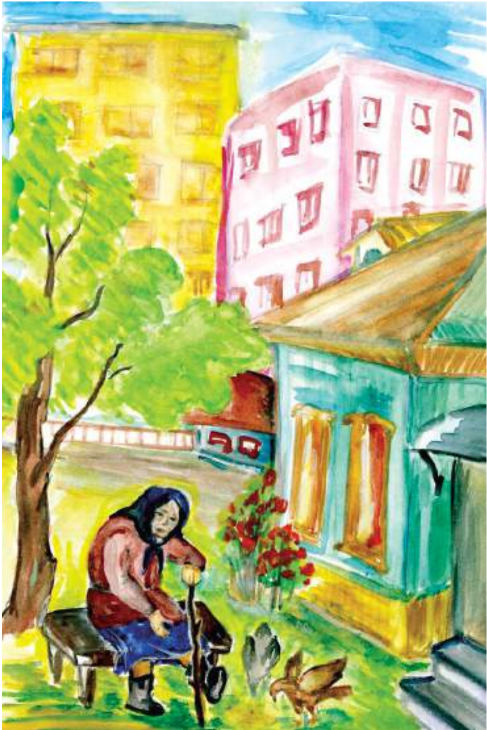
Колосова Виолетта, 14 лет